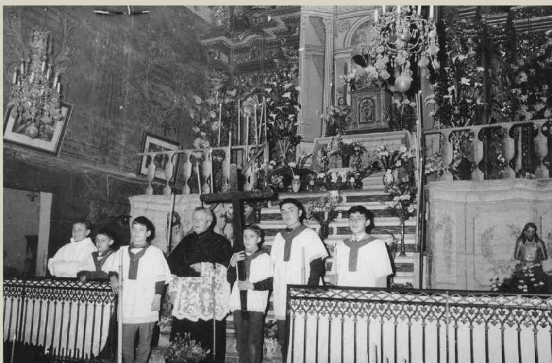
Le monument placé dans le chœur de l'église (années 1950, photo H. Darrey)

Le monument était complété par deux statues disposées de part et d'autre de l'escalier du monument . Réalisées en carton-pâte, la statue de gauche représente le Christ à la colonne et celle de droite l'Ecce Homo. Peut-être s'agit-il de statues appartenant à des misteris, placées autour du monument avant leur sortie en procession le Jeudi saint au soir.