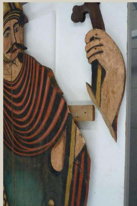
Problème d'assemblage au niveau du support