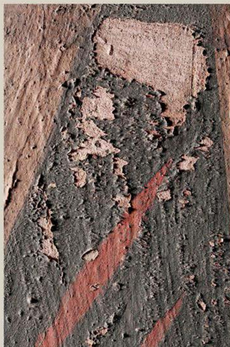
Pulvérisation de la couche picturale

L'objectif de l'intervention a donc été de stabiliser les dégradations présentes sur ces deux éléments en consolidant le support et en refixant la polychromie, de manière à améliorer la lisibilité de l'image. Un système de piétement a été spécialement conçu, permettant aux deux soldats de se tenir droits.