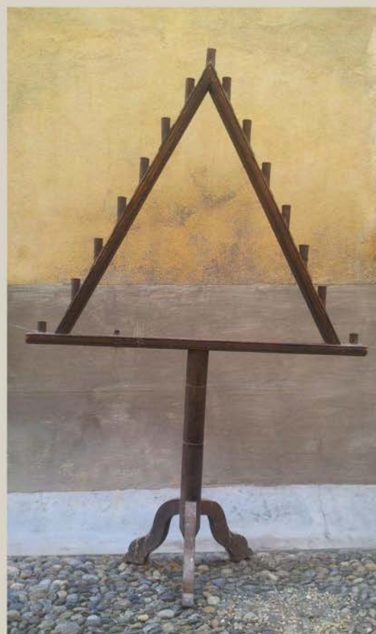
Chandelier des ténèbres

Le chandelier des ténèbres d'Ille-sur-Tet présente une forme classique. Sa partie supérieure est constituée d'un support de forme triangulaire dont les pentes sont équipées de 15 bobèches métalliques, permettant de fixer les cierges. Le triangle est soutenu par une courte hampe en bois de section circulaire, fichée dans un pied à base tripode.